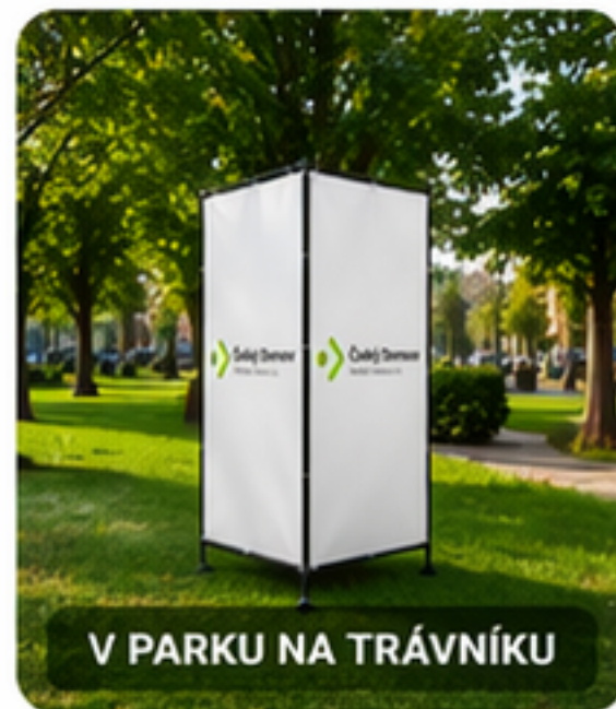
V PARKU NA TRÁVNÍKU

Nosič nevyžaduje zásah do povrchu – bez vrtání a kotvení.